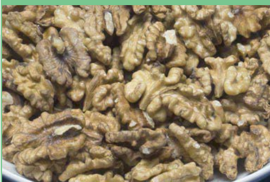
Mitades Light Amber/Amber*