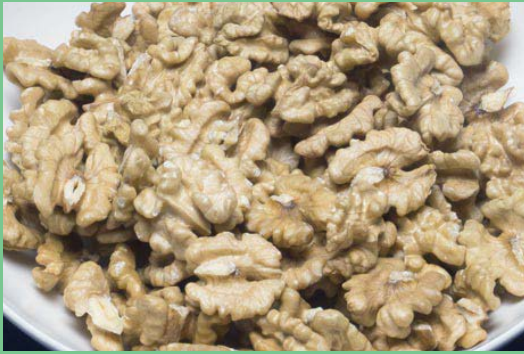
Mitades Extra Light*