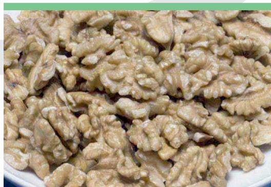
Mitades Extra Light - Light* 20-80